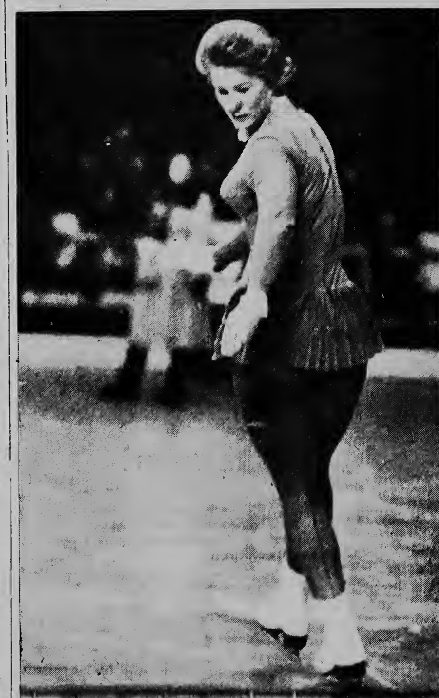
Como quiera cu ya Sjoukje Dijkstra a conquista campeona-tanto di mundo como tambe di Europa, nos ta mire aqui na Praag durante di su numero di kunstrijden i e ovasion cu el a ricibi na Praag pa su victoria tabata enorme.

Den e luganan aqui ta ainda mas conoci cu e cantante Mericano i estrellita cinematografico Johnny Nash. Naci na Texas, Johnny a cuminsa su carrera na 1957 ora cu el a ser desahuri pa e jaago di talentonan Arthur Godfrey. Esaki tabata asina entusiasma cu Johnny su cantamentu cu regularmente e tabata large aparece den su programa di television. I esaki tabata un principio numero... A sigui pronto awor contract cu firmanan di disco, entre otro cu ABC-Paramount, pa kende el a canta e numero „A Teenager sings the blues“. Como hungado di hoedrol el a hunga den e pelicula „Take a giant step“, mientras e tabatin un rol menos importante den „Key Witness“. Sin duda Teenagers di Aruba lo jena teatro De Veer i Principal jen-jen dia 7 di april p.v.